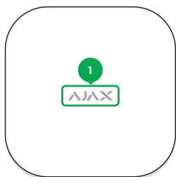
1 - Логотип со световым индикатором.